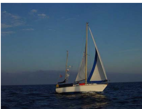
Seilas i Middelhavet

Vi skal være hjemme til 1 august så da er det en utvilt vektarbeider ledig på jobbmarkedet. Dere får ha en fin vår og sommer hjemme.