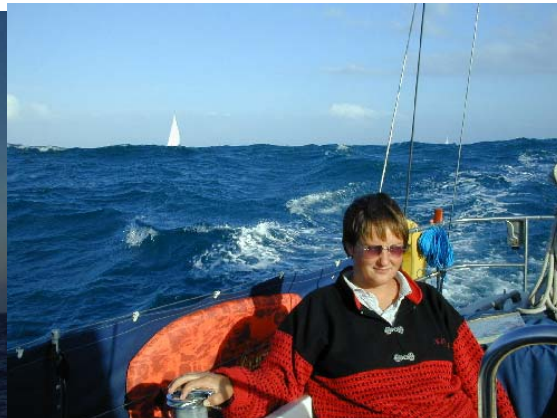
Store bølger i Middelhavet også. Vi ser kun toppen av seilet på de vi seilte sammen med.